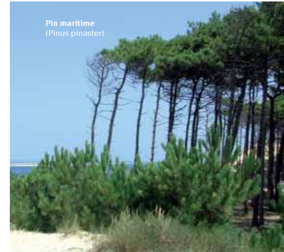
Pin maritime (Pinus pinaster)

Curé-herboriste Künzle - Les bienfaits de la nature